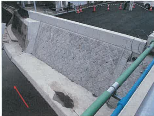
右岸（にしてつ通り商店街側）