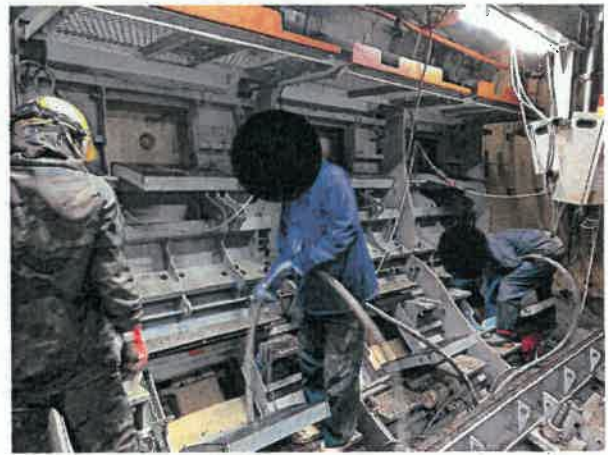
コンクリート打設状況