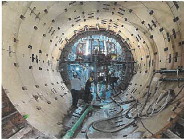
コンクリート打設前