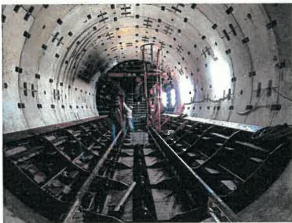
型枠組み立て状況