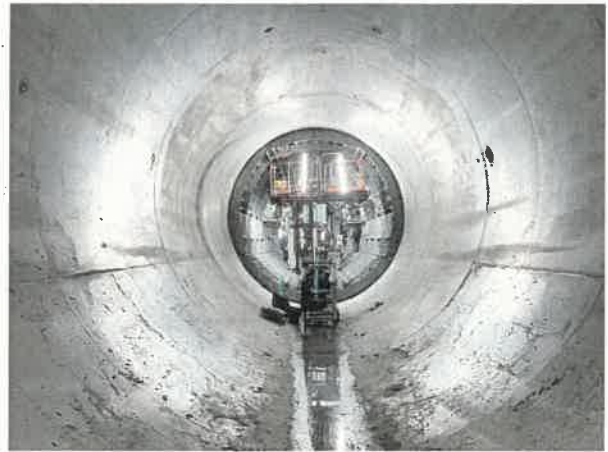
コンクリート打設後